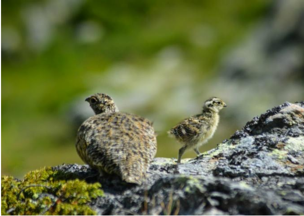
Lagopèdes, Hauts de Fully

Elisa Buthey nous invite à nous approcher de ce qui nous est proche, familier. Parfois, croyant connaître une fleur du fait de sa présence à proximité, nous ne la regardons plus. Ou nous regardons et ne voyons pas. L'exposition Montagn'art propose de découvrir le regard d'Elisa. Deux espaces, intérieur et extérieur, sont investis par la jeune photographe. Une sélection de fleurs des alpes est accrochée aux cimaises de la cabane du Demècre : centaurée des Alpes, anémone soufrée, petite tortue et bois gentil, bourdon et crocus... A l'extérieur, dans la prairie et au milieu des rochers jouxtant la cabane, sont installées des images du monde sauvage: traquet motteux, lagopède, mais aussi bouquetin, chamois, marmotte.